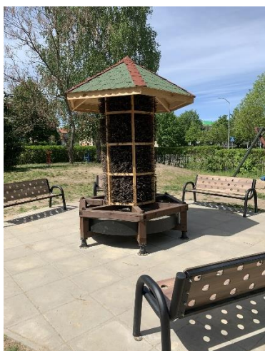
(źródło: autor projektu)