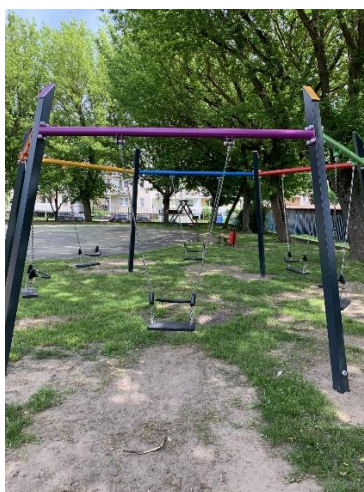
(źródło: autor projektu)