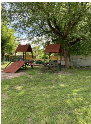
(źródło: autor projektu)