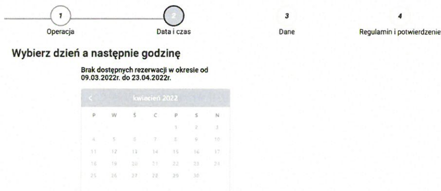
Rysunek 1 Zrzut ekranu systemu elektronicznej rezerwacji terminu złożenia wniosku paszportowego z dn. 8 marca 2022 roku.

W ostatnim czasie na terenie województwa zachodniopomorskiego odnotowuje się wzmożony ruch osób ubiegających się o wydanie nowego dokumentu podróży. Problem daje się zidentyfikować w chwili podjęcia prób rezerwacji terminu do złożenia stosownego wniosku. Pomimo wielu możliwości, które w przedmiotowym zakresie oferuje Zachodniopomorski Urząd Wojewódzki w Szczecinie zarówno tradycyjna forma doręczenia stosownego formularza bez uprzedniej rezerwacji wizyty, jak i za pośrednictwem kanałów komunikacji elektronicznej, przysparza mieszkańcom Gminy Police wielu trudności. Jednocześnie, zwracam uwagę, że w chwili tworzenia przedmiotowej interpelacji system internetowy ZUW nie umożliwiał rezerwacji terminu aż do 24 kwietnia 2022 roku.