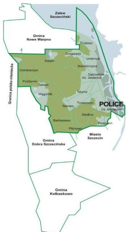
Rys. 2. Sołectwa Gminy Police

Police są gminą miejsko- wiejską, w jej skład wchodzi miasto Police i dwanaście sołectw: Dębostrów, Drogoradz, Niekłończyca, Pilchowo, Przęsocin, Siedlice, Tanowo, Tatynia, Trzebież, Trzeszczyń, Uniemyśl i Wieńkowo. Poniższa mapa przedstawia położenie sołectw i bezpośrednio sąsiadujące gminy: Szczecin, Kołbaskowo, Dobrą Szczecińską, Nowe Warpno.