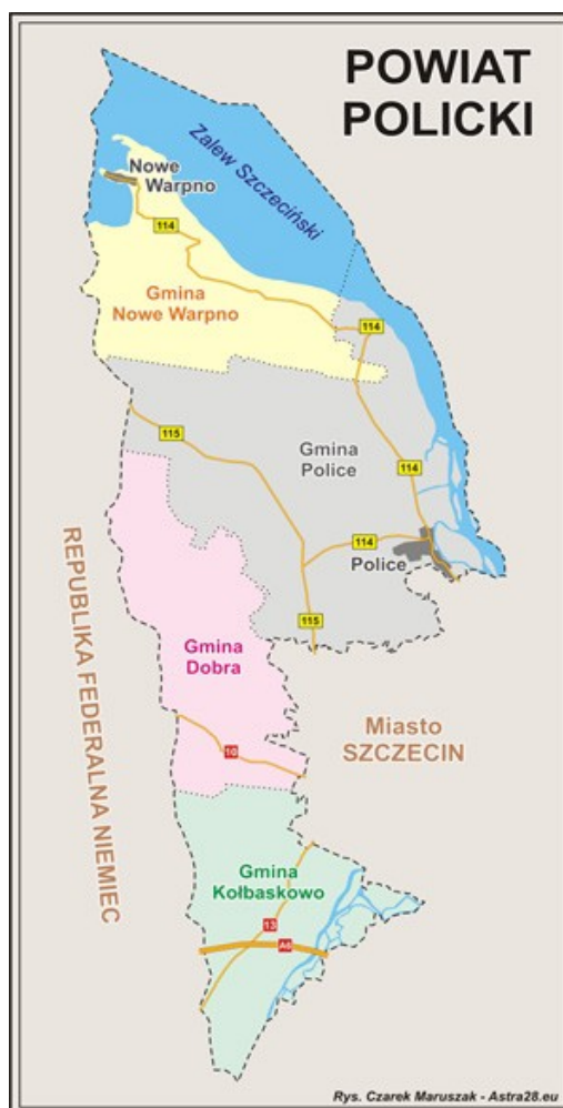
Rys.1. Położenie Powiatu i Gminy Police