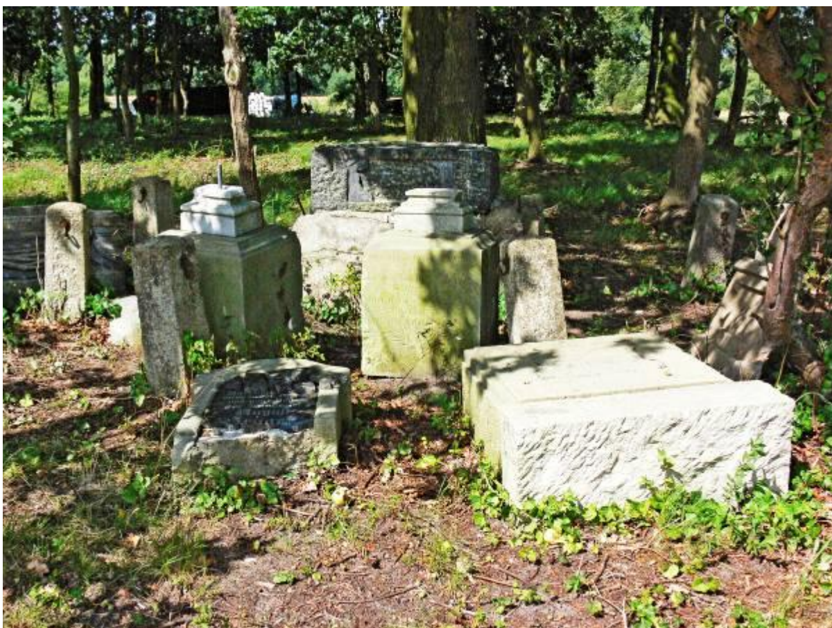
Teren niemieckiego cmentarza zlokalizowany w głębi wsi z zachowanymi elementami płyt nagrobnych.