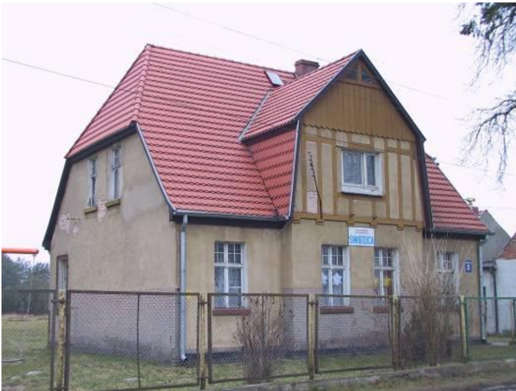
Budynek świetlicy w Uniemyślu

Zgodnie z przeprowadzoną ekspertyzą stwierdzono bardzo zły stan techniczny konstrukcji dachu oraz przekroczony stan nośności i użytkowania niektórych elementów więźby dachowej. Kominy budynku wykazują znaczny stan zużycia i powinny zostać poddane gruntownej naprawie. Stolarka okienna i drzwiowa jest w złym stanie technicznym i wymaga całkowitej wymiany.