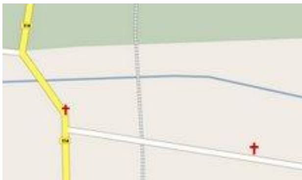
Lokalizacja poniemieckich cmentarzy na terenie miejscowości Uniemyśl.