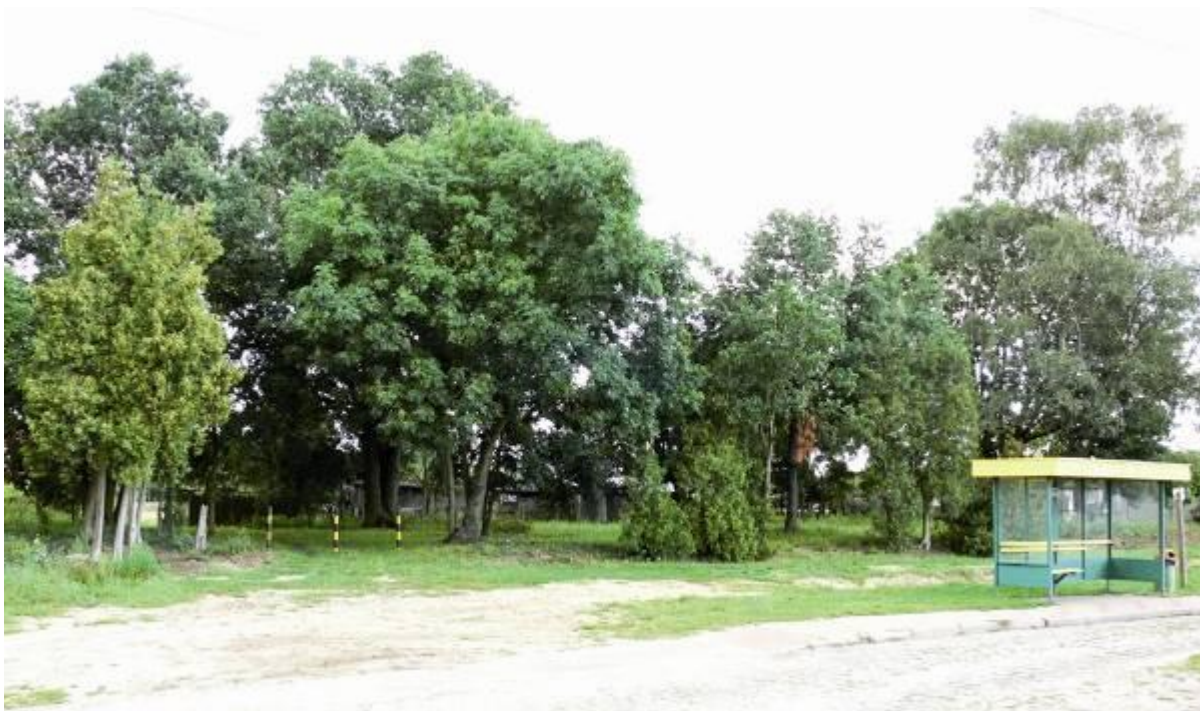
Cmentarz zlokalizowany przy drodze Jasienica – Trzebież, za przystankiem autobusowym.