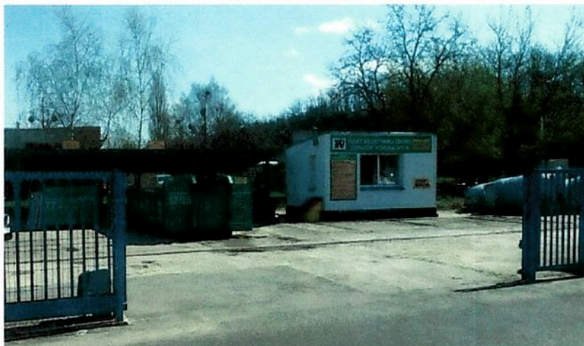
Fot. nr 4 PSZOK – Punkt Selektywnej Zbiórki Odpadów Komunalnych