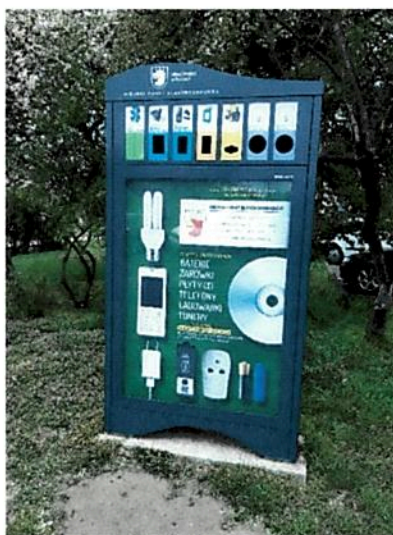
Fot. nr 2 Miejski Punkt Elektroodpadów (MPE)

Ponadto na terenie miasta Police funkcjonują urządzenia MPE (Miejskie Punkty Elektroodpadów. Przeznaczone są one do gromadzenia odpadów takich jak: zużyte baterie, akumulatory, żarówki i świetlówki, tonery atramentowe, telefony komórkowe, płyty CD/DVD itp. Pojemniki te pełnią także funkcję informacyjną. Plakaty, które zostały umieszczone na nich przypominają mieszkańcom o potrzebie segregacji odpadów. Urządzenia te znajdują się w 4 miejscach: przy ul. Bankowej 18 (obok budynku Urzędu Miejskiego), przy ul. Bankowej (przed wejściem na targowisko), przy ul. Grunwaldzkiej (w pobliżu ul. Sikorskiego) oraz przy ul. Przyjaźni w Policach.