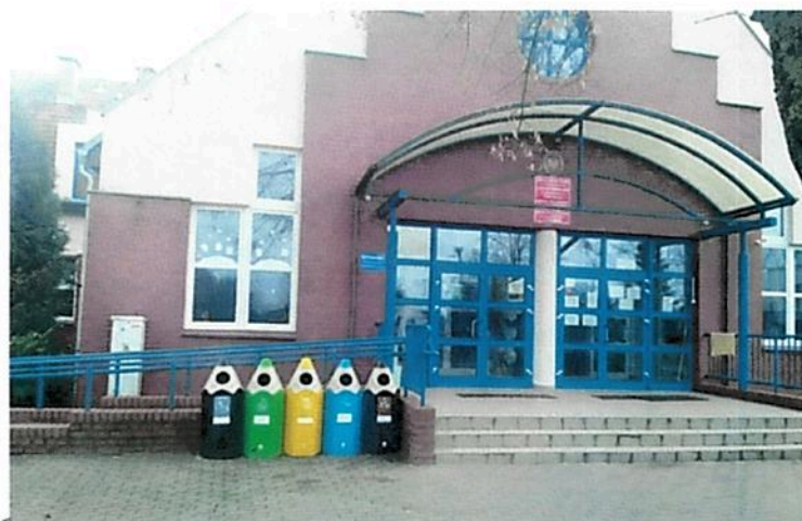
Fot. nr 4 Szkoła Podstawowa im. Jerzego Noskiewicza z Oddziałami Dwujęzycznymi i Przedszkolnymi w Tanowie

W ramach akcji edukacyjno-informacyjnej w 2020 roku do każdego domu jednorodzinnego Wydział Gospodarki Odpadami przekazał ulotki informacyjne na temat właściwej segregacji odpadów. Ponadto została uruchomiona strona internetowa www.odpady.police.pl na której umieszczone są wszelkie niezbędne informacje dotyczące systemu gospodarowania odpadami i prawidłowej segregacji. W celu kształtowania postaw proekologicznych wśród dzieci zakupiono kolorowe kosze do segregacji odpadów w kształcie kredek. Pierwsze kosze zostały rozstawione w 2020 r. na placach zabaw 6 największych szkół podstawowych w Gminie Police.