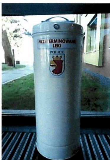
Fot. nr 3 Pojemnik na przeterminowane leki

Gmina Police kontynuowała bezpłatną zbiórkę przeterminowanych i niewykorzystanych leków. Można było je wrzucać do specjalnych pojemników, które zostały umieszczone w aptekach na terenie Gminy Police.