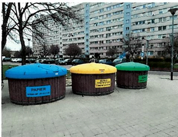
Fot. nr 1 Komplet pojemników półpodziemnych do segregacji

Selektywna zbiórka odpadów odbywała się w systemie pojemnikowym w zabudowie wielorodzinnej, gdzie we wskazanych przez zarządców miejscach ustawione zostały pojemniki na niesegregowane (zmieszane) odpady komunalne, papier, szkło, metale i tworzywa sztuczne oraz bioodpady. Natomiast w zabudowie jednorodzinnej zbiórka odpadów odbywała się w systemie pojemnikowo-workowym. W pojemnikach gromadzone były niesegregowane odpady zmieszane oraz bioodpady (z terenu miasta Police. W workach odbierane był pozostałe frakcje selektywnie zebranych odpadów ( papier, szkło, metale i tworzywa sztuczne) oraz bioodpady z terenu sołectw Gminy Police. W praktyce w przeważającej części zmieszane odpady komunalne odbierane były z zabudowy jednorodzinnej z pojemników 120L i 240L oraz z zabudowy wielorodzinnej z pojemników o pojemności 1100L. Odpady takie jak metale i tworzywa sztuczne w zabudowie wielorodzinnej zbierane były w pojemnikach siatkowych o pojemności 2,5 m 3 , odpady opakowaniowe ze szkła z pojemnikach typu „igloo” o pojemności 1,5 m 3 oraz papier w pojemnikach o pojemności 1,1 m 3 . Worki do selektywnej zbiórki w zabudowie jednorodzinnej mają pojemność 120 litrów (na papier oraz metale i tworzywa sztuczne) oraz 80 litrów (na szkło). W 2020 zamontowano 2 kolejne komplety pojemników półpodziemnych przeznaczonych do selektywnej zbiórki odpadów (w sumie na terenie miasta Police na dzień 31.12.2020 było 15 kompletów).