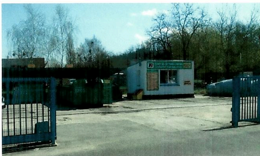
Fot. nr 4 PSZOK – Punkt Selektywnej Zbiórki Odpadów Komunalnych