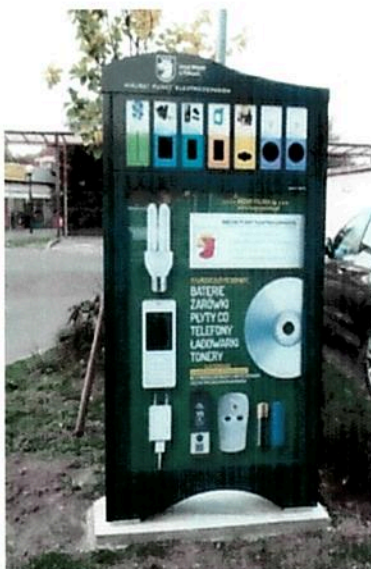
Fot. nr 2 Miejski Punkt Elektroodpadów (MPE)

Ponadto na terenie miasta Police funkcjonują urządzenia MPE (Miejskie Punkty Elektroodpadów. Przeznaczone są one do gromadzenia odpadów takich jak: zużyte baterie, akumulatory, żarówki i świetlówki, tonery atramentowe, telefony komórkowe, płyty CD/DVD itp. Pojemniki te pełnią także funkcję informacyjną. Plakaty, które zostały umieszczone na nich przypominają mieszkańcom o potrzebie segregacji odpadów. Urządzenia te znajdują się w 4 miejscach: przy ul. Bankowej 18 (obok budynku Urzędu Miejskiego), przy ul. Bankowej (przed wejściem na targowisko), przy ul. Grunwaldzkiej (w pobliżu ul. Sikorskiego) oraz przy ul. Przyjaźni w Policach.