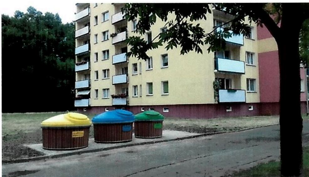
Fot. nr 1 Komplet pojemników półpodziemnych do segregacji

Selektywna zbiórka odpadów odbywała się w systemie pojemnikowym w zabudowie wielorodzinnej, gdzie we wskazanych przez zarządców miejscach ustawione zostały pojemniki na niesegregowane (zmieszane) odpady komunalne, papier, szkło, metale i tworzywa sztuczne oraz bioodpady. Natomiast w zabudowie jednorodzinnej zbiórka odpadów odbywała się w systemie pojemnikowo-workowym. W pojemnikach gromadzone były niesegregowane odpady zmieszane oraz bioodpady (z terenu miasta Police. W workach odbierane był pozostałe frakcje selektywnie zebranych odpadów ( papier, szkło, metale i tworzywa sztuczne) oraz bioodpady z terenu sołectw Gminy Police. W praktyce w przeważającej części zmieszane odpady komunalne odbierane były z zabudowy jednorodzinnej z pojemników 120L i 240L oraz z zabudowy wielorodzinnej z pojemników o pojemności 1100L. Odpady takie jak metale i tworzywa sztuczne w zabudowie wielorodzinnej zbierane były w pojemnikach siatkowych o pojemności 2,5 m 3 , odpady opakowaniowe ze szkła z pojemnikami typu „igloo” o pojemności 1,5 m 3 oraz papier w pojemnikach o pojemności 1,1 m 3 . Worki do selektywnej zbiórki w zabudowie jednorodzinnej mają pojemność 120 litrów (na papier oraz metale i tworzywa sztuczne) oraz 80 litrów (na szkło). W 2019 zamontowano 4 kolejne komplety pojemników półpodziemnych przeznaczonych do selektywnej zbiórki odpadów (w sumie na terenie miasta Police jest 13 kompletów).