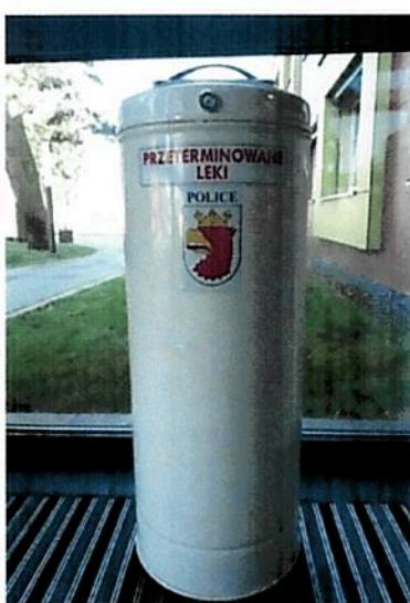
Fot. nr 3 Pojemnik na przeterminowane leki

Gmina Police kontynuowała bezpłatną zbiórkę przeterminowanych i niewykorzystanych leków. Można było je wrzucać do specjalnych pojemników, które zostały umieszczone w aptekach na terenie Gminy Police.