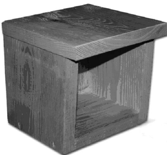
TYP NR 3 BUDKA LĘGOWA DLA DYMÓWKI