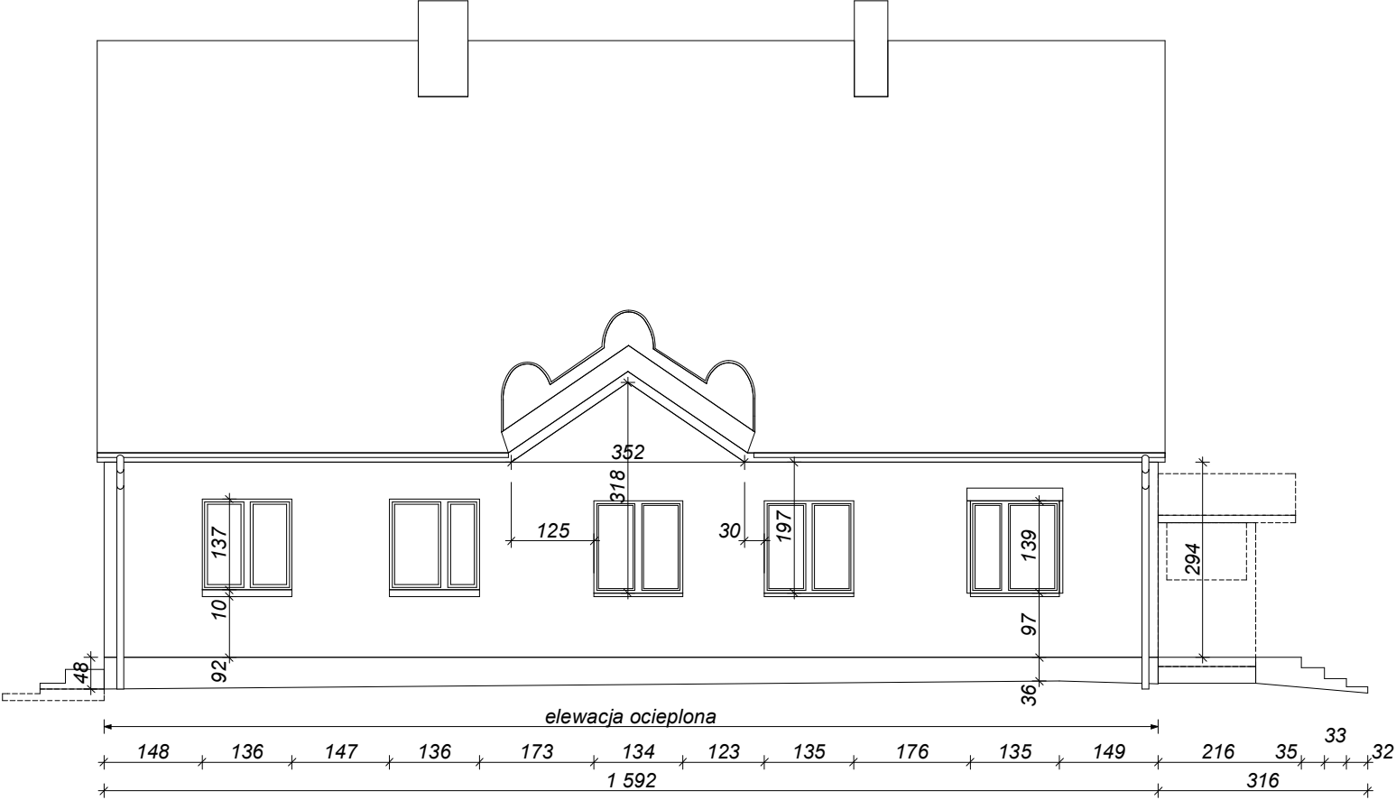
ELEWACJA BOCZNA 2 (podłużna)