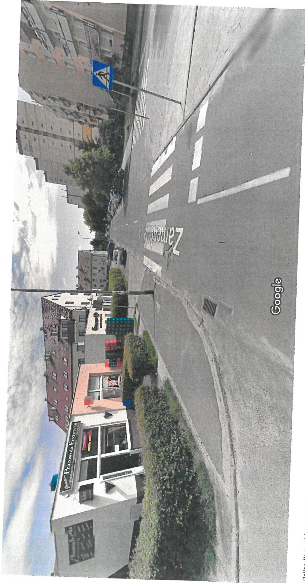
Police, Województwo zachodniopomorskie Street View - cze 2013