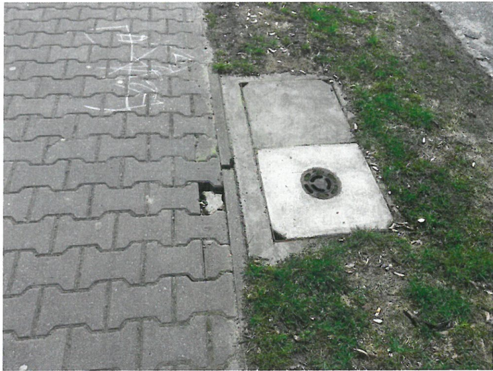
Boh. Westerplatte 21