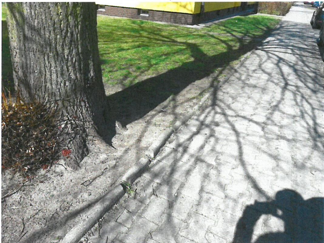
Boh. Westerplatte 22