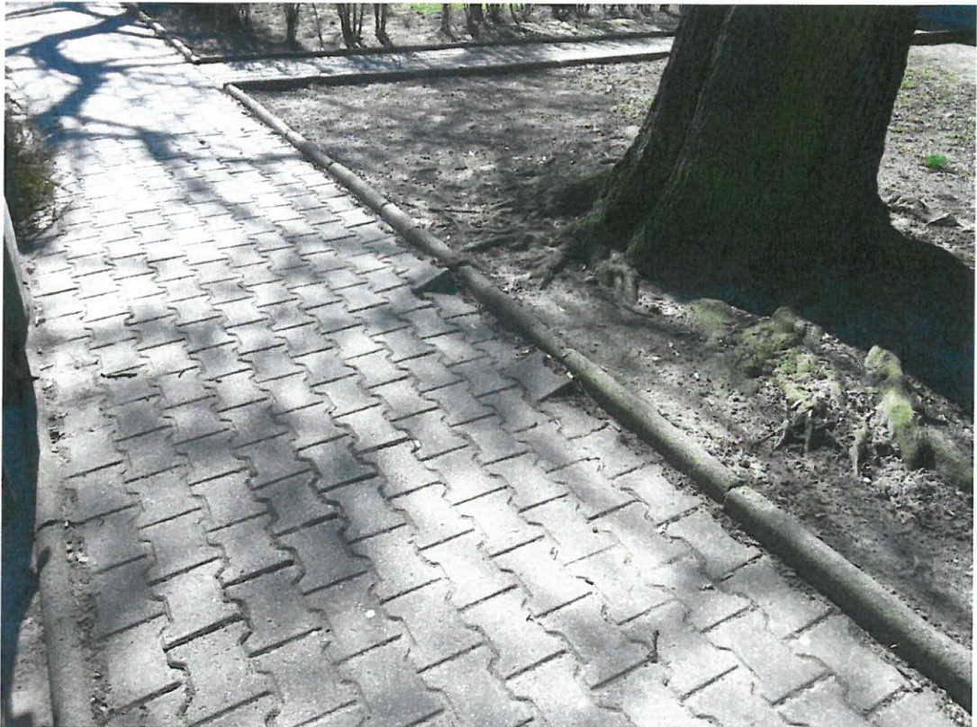
Boh. Westerplatte 28