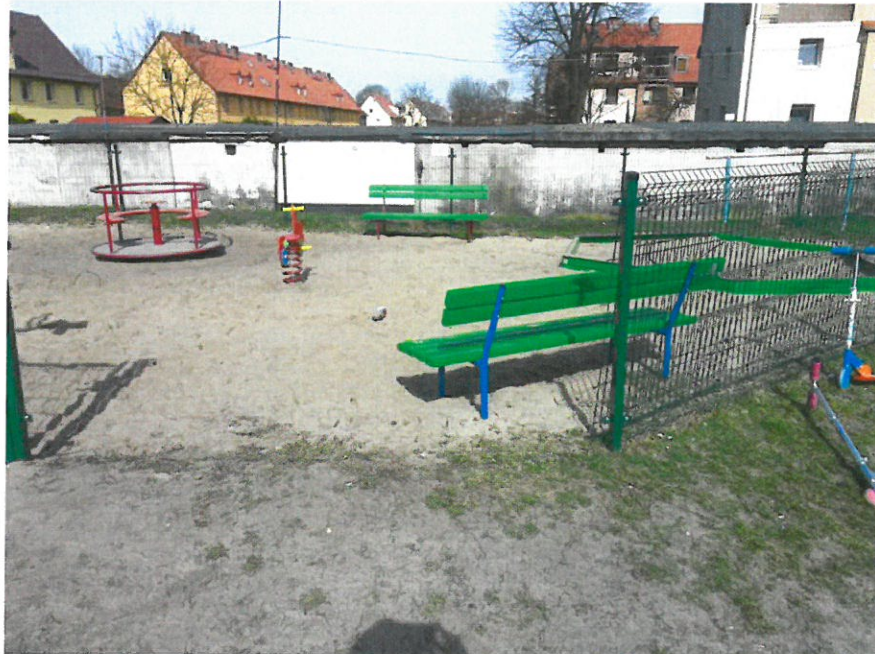
Zostały odczepione dwa przęsła ogrodzenia tego placu zabaw.