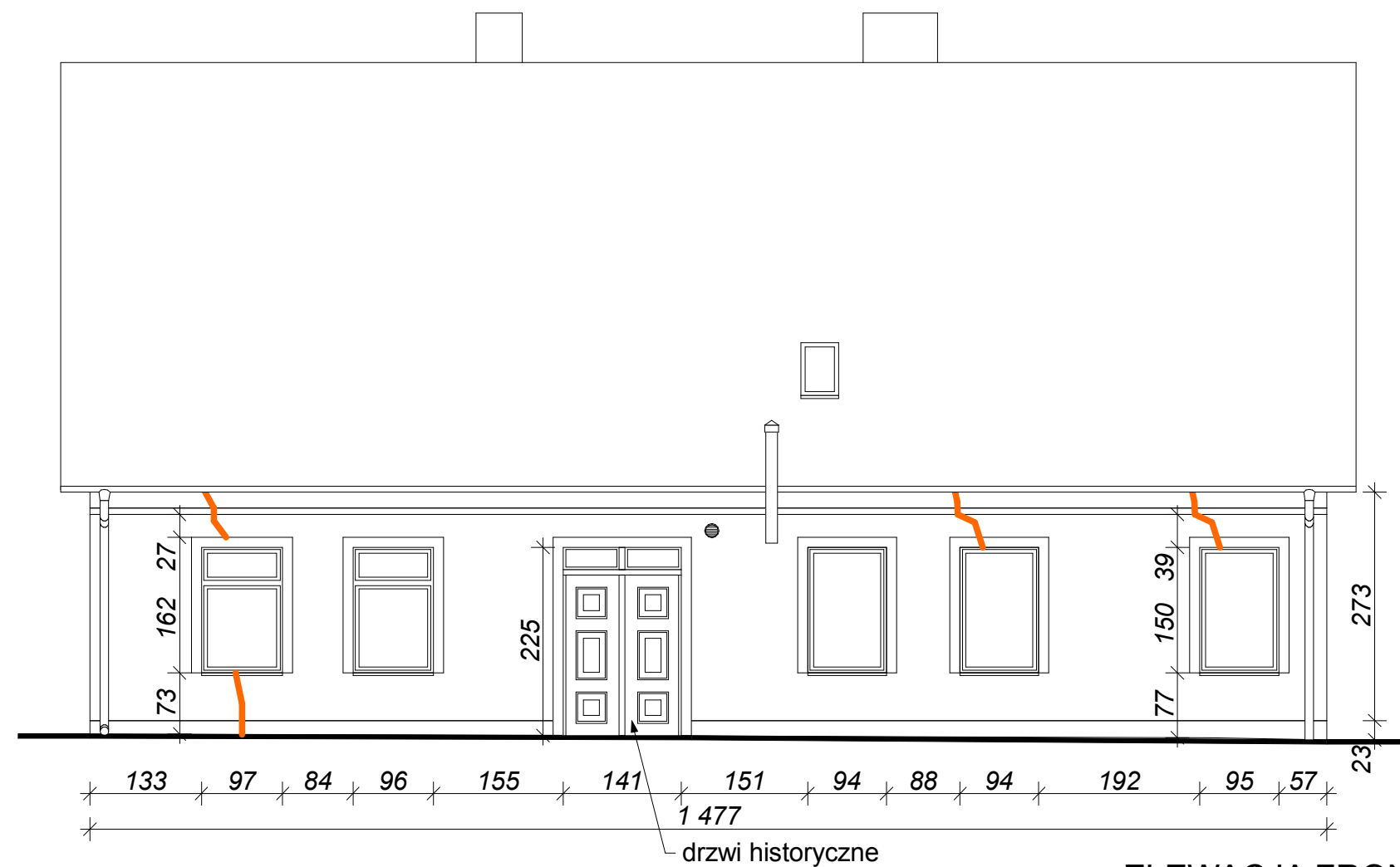
ELEWACJA FRONTOWA OD STRONY UL. PIASTÓW